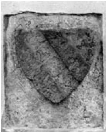
Bohuslavice, kostel sv. Mikuláše, erb pánů z Dobrušky z torza náhrobku druhotně osazeného ve vnějším zdivu barokní kostnice