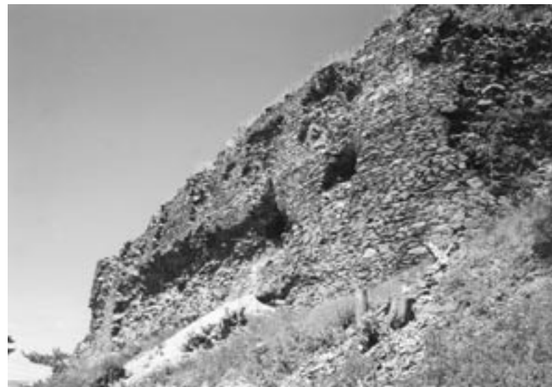
Hrad Frymburk, pohled od jihu