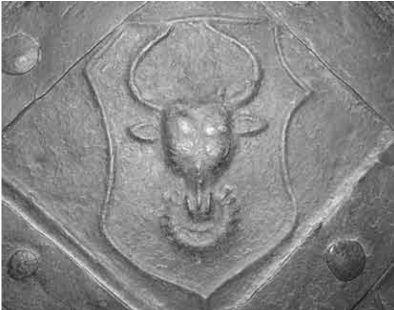
Výzdoba rodovým znakem na dveřích tovačovského zámku.

konkurovala lepšími podmínkami pro poddané. Ti pak dávali samozřejmě přednost panstvím s menším zatížením. Úbytky v počtu osedlých byly zaviněny válkami, epidemiemi a živelnými pohromami. Vzhledem k pravidelnému používání ohně v otevřených ohništích se není čemu divit. Máme zachováno množství zpráv o řádění červeného kohouta. Osedlí bývají v berních listech označováni jako pohořelí a jsou osvobozeni na několik let od placení stálých platů. Vrchnost v tomto případě nemusela za pohořelé odvádět daň. Kromě ohně se setkáváme s dalším živlem – vodou. Ta škodila osedlým při jarních záplavách nebo v podobě krup. 14)