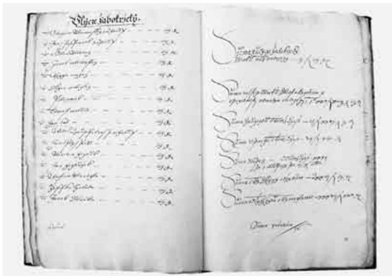
Zápis z kojetínského urbáře z let 1596/97.

ve zcela odlišné oblasti než zbylá pernštejnská panství. Tím bylo také dáno rozložení poddaných, které nalezneme v malých vesnicích, které nemohou korespondovat s velkými vesnickými celky na rovině. 21)