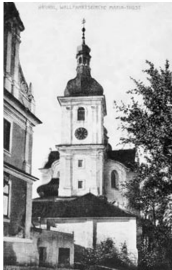
Dobrá Voda v Novohradských horách, farní a poutní kostel Nanebevzetí Panny Marie, na počátku 20. století, pohled od jihovýchodu.

Dobrá Voda bylo vždy pověstné posvátné místo pro německé i pro české poutníky, procesí ke zdejšímu kostelu přicházela i ze značně velkých vzdáleností. Tradice poutí se v omezené míře udržo-