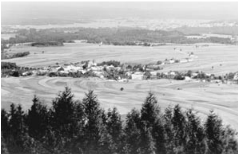
Horní Stropnice na počátku 20. století.

Ve 20. letech 20. století zde žilo přibližně sedm set padesát Němců, osmdesát Čechů a sedm Židů. Německá škola měla šest tříd. Ve Stropnici byla také jedna třída české školy, do které chodilo kolem třiceti dětí. Česká třída byla v hostinci U Facknerů. V roce 1926 začal přes Stropnici jezdit autobus linky Nové Hrady–Německý Benešov. 28. prosince 1926 se ve Stropnici poprvé rozsvítily elektrické žárovky, protože obec byla připojena na elektrárnu, kterou v Novém mlýně zřídil dr. Buchhäcker.