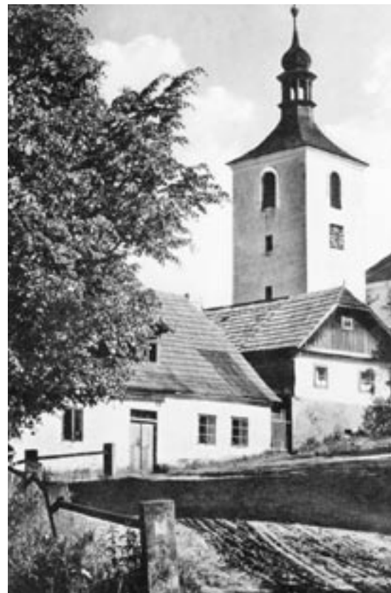
Hojná Voda na počátku 20. století, dodnes zachovalá věž zvonice, která stála vedle zaniklého kostela sv. Anny.

Většina mladých mužů se nevrátila z front druhé světové války. Po válce bylo v Hojně Vodě napočítáno osmdesát čtyři mužů, sto deva-