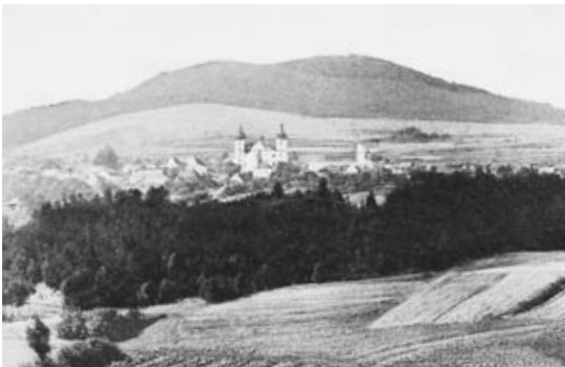
Dobrá Voda s panoramatem Novohradských hor na počátku 20. století.

Aby bylo klidné místo prakticky využito, byl vedle hřbitova zřízen domov důchodců. Rovněž fara sloužila jako domov důchodců pro kněze. O bývalých obyvatelích si lze obrázek udělat na hřbitově. Hrobky s honosnými pomníky i skromné křížky na jiných hrobech jsou určitým dokladem o majetkových poměrech zdejšího obyvatelstva.