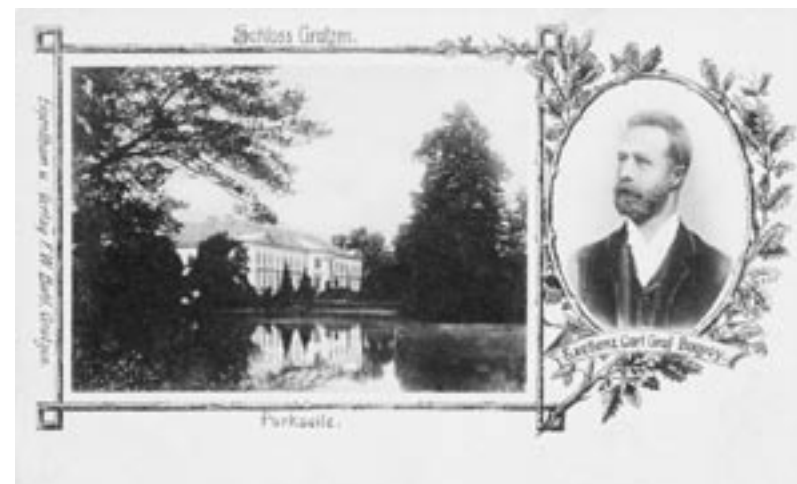
Nové Hrady, zámek na počátku 20. století s portrétem hraběte Karla Buquoye †1911.

Uprostřed náměstí je čtvercová kašna, kterou chrání stín několika stromů. Plochu vkusně vyplňuje obyčejný trávník, protkaný cestičkami.