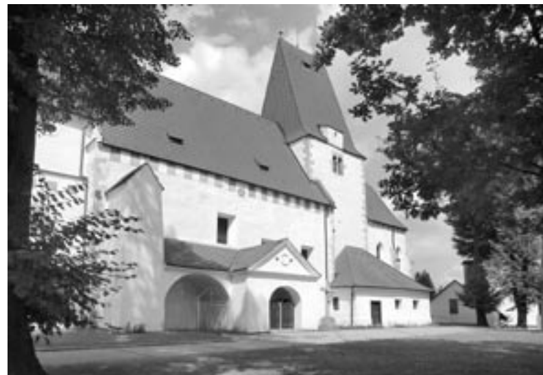
Horní Stropnice, kostel sv. Mikuláše.