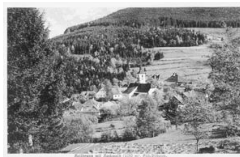
Hojná Voda na počátku 20. století.

Patrně už při příchodu prvních křesťanů do kraje stávala u pramene kaplička. Vyprávělo se, že se poblíž těžce zranil nějaký dřevorubec,