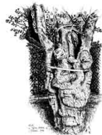
Kmen hlohu – nenapodobitelné dílo přírody.

Podmáčený terén na mokřích lukách na východní straně města za Zlatou stokou byl vždy prostorem nevhodným pro zástavbu. Ještě v polovině 19. století zde byly pouze měšťanské zahrady a v jedné z nich vyrostl zřejmě i tento pozoruhodný hloh. Hned vedle hlohu nalezneme jednu třeboňskou zvláštnost – zahradní domek, v němž bydlel Josef Kajetán Tyl v době svého v pořadí již druhého pobytu v Třeboni, krátce před smrtí roku 1856.