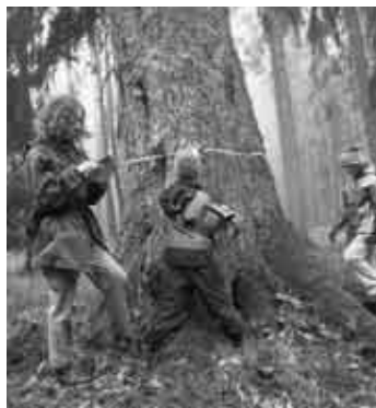
Žindra Prach s Ondrou Knoppem měří obvod smrku u Karštejna.

ve 130 cm nad zemí. U stromů ve svahu je 130 cm odhadováno od paty kmene, tj. od místa, kde strom vyrůstá ze země (většinou 130 cm od země nahoře na svahu, má-li strom dole obnažené kořeny, nebo níže, je-li pata kmene spíše dole a shora je kmen zasypán). Obvod se měří vždy kolmo k ose kmene, nikoli podle svahu (tak často vznikají nadhodnocené údaje). U stromů, které se nízko větví a směrem nahoru se rozši-