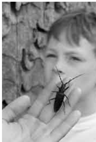
Larvy tesaříka obrovského se vyvíjejí ve starých dubech.

Jsem dub letní a bydlím na hrázi Opatovického rybníka u města Třeboně. Je to moc dobré místo pro život. Kořeny mám