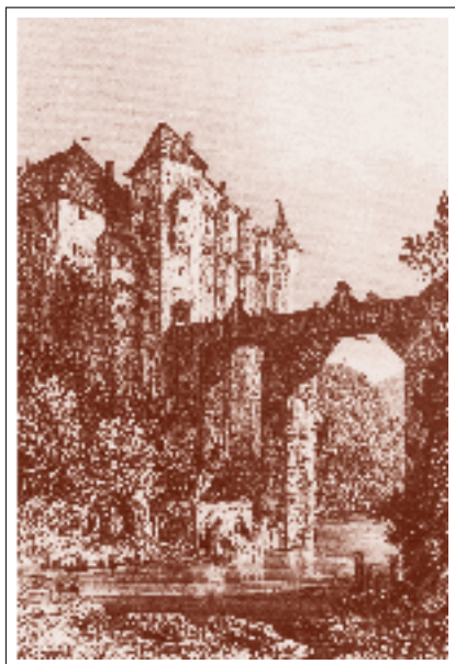
◆ Hrad Hunyad v Transylvánii, rodový hrad Hunyadiů. Vyobrazení z 19. století. ◆

Prvním významnějším členem rodu, o kterého se začali zajímat současní spisovatelé a historici, byl Jan Hunyadi, otec Matyáše Korvína. Až s jeho osobou jsou spojeny pokusy o zjištění jeho původu, a tedy původu rodiny. Autor soudobé kroniky celských knížat o něm píše, 3 že pocházel z Valašska z malého šlechtického rodu. V tomto směru se nijak neodchyluje od jiných autorů, kteří vždy narážejí na valašský původ rodiny nejen u Jana Hunyadiho, ale také u jeho syna Matyáše – např. Staré letopisy české k roku 1469 4 či další Jan Długosz a Aeneas Silvius Piccolomini. Z dobových historiků píšících v Uhrách – Ransano, Thuróczi, Bonfini – se také všichni shodnou na valašském původu Hunyadiho. Rodi-