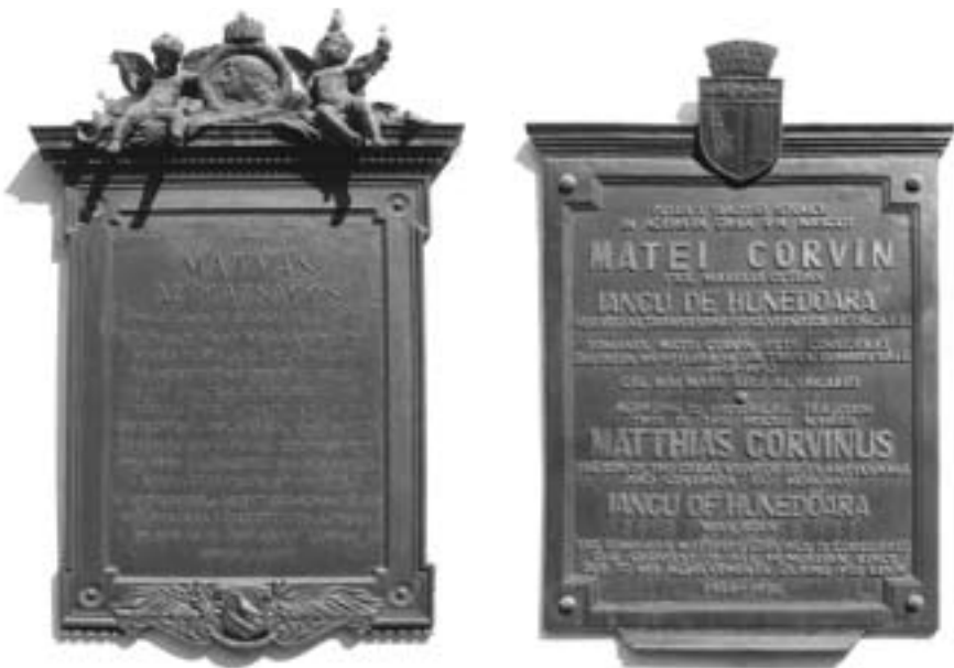
◆ Pamětní desky na rodném domu Matyáše Korvína v Kluži. ◆ Vlevo maďarská z roku 1888 připomínající privilegia darovaná Matyášem a potvrzovaná dalšími panovníky, vpravo rumunská z roku 1995, která označuje Matyáše za Rumuna (viz pozn. 27 úvodu).