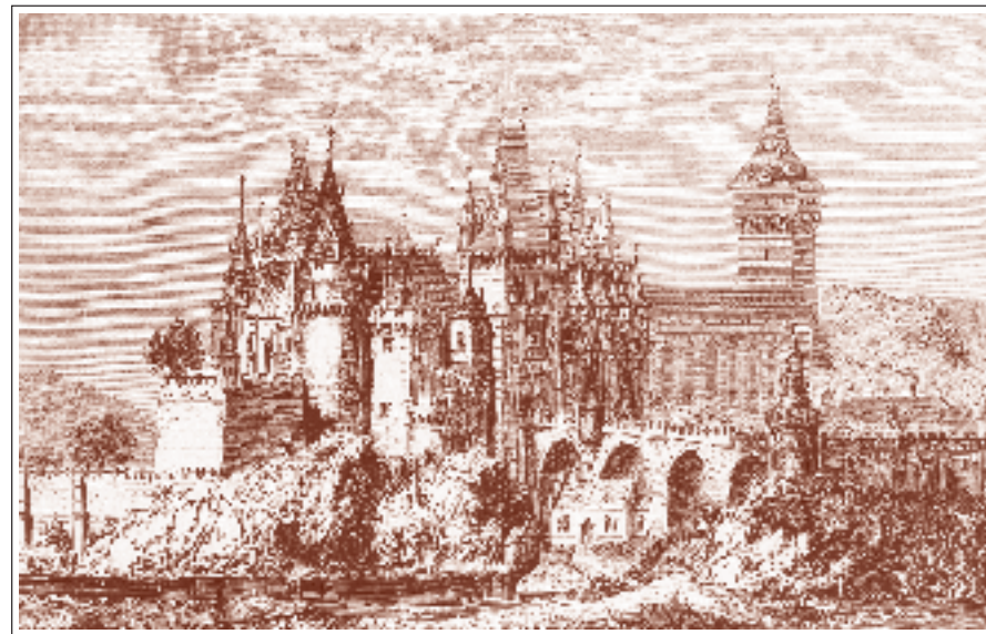
◆ Hrad Hunyad v Transylvánii, rodový hrad Hunyadiů. Vyobrazení z 19. století. ◆