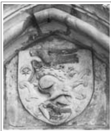
◆ Erb rodiny Hunyadi nad jedním z portálů na hradě Hunyadu. ◆

a jeho jméno přinesl rozšiřoval sever- ria. Členové rodiny mi císaři do Panonie vojenských taženích tům a různým ger- nům. Krev zůsta- a vydala sémě zno- nus. Také podle tom místě (nazývá la“) přežívali předci dobu. 12 K této ver- Matyáše Hunyadiho Ovšem zde je nutno nedávno upozornil propojení se starým bylo velice úspěšné diska pozdějšího šův nemanželský